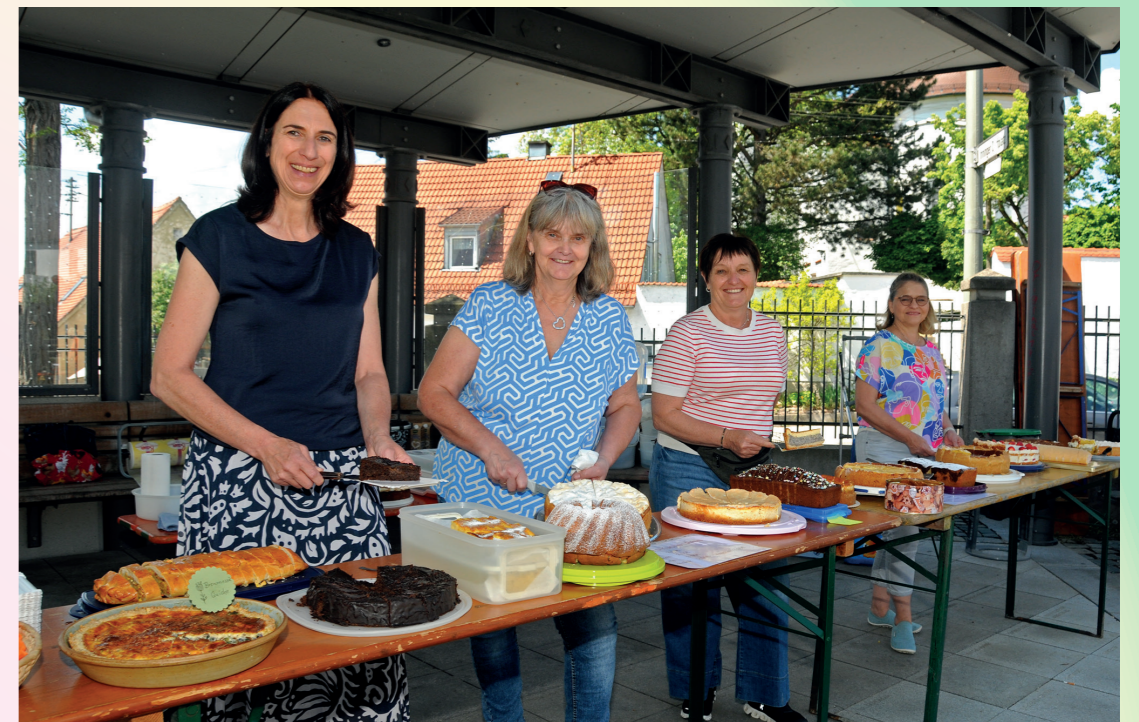
Traditionelles Highlight auf dem Inninger Flohmarkt: das Kuchenbuffet