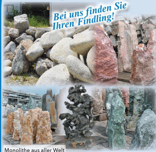
Monolithe aus aller Welt

Beste Qualität, überraschend preisgünstig!