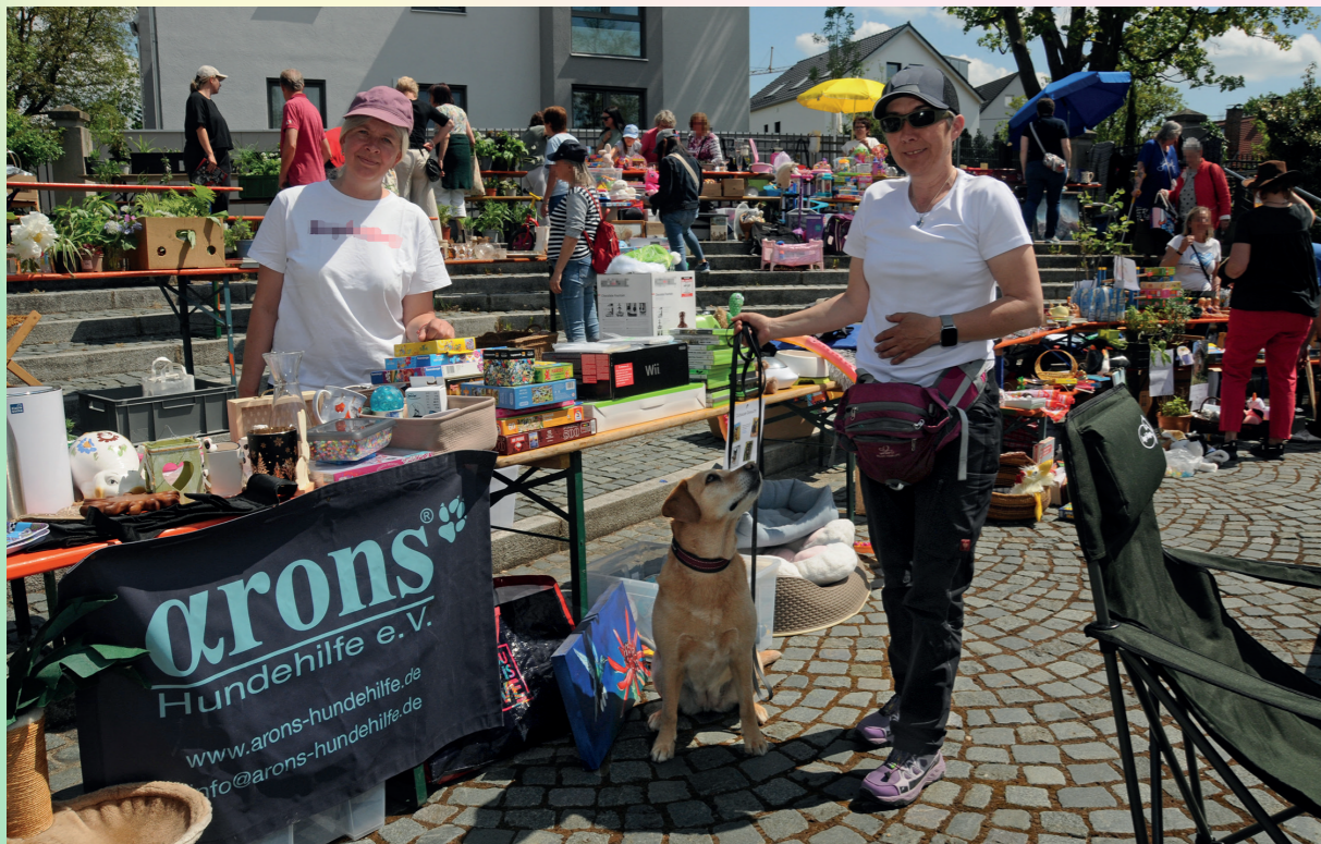
Der Hund ist treuer Begleiter und natürlich unverkäuflich!