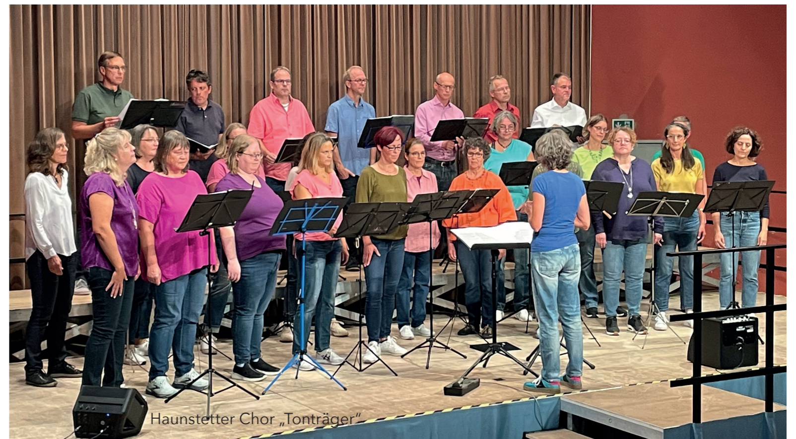
Haunstetter Chor „Tonträger“

*Am Samstag, den 9. Mai 2026 um 19.30 Uhr lädt der Augsburger Chor „Tonträger“ wieder zu einem Doppelkonzert in das evangelische Gemeindezentrum St. Johannes nach Königsbrunn ein. Zu Gast ist diesmal der hessische Chor „TonArt“ aus Alsbach. Das gemeinsame Repertoire umfasst Stücke aus Klassik, Pop und Jazz. Der Eintritt ist frei.*