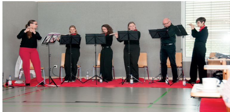
Für die musikalische Untermalung sorgten Mitglieder des Spieltheaterorchesters Flute & Drums