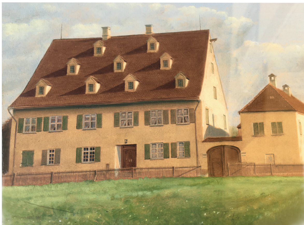
Das Untere Gögginger Schlösschen um 1850.

Das Untere Schlösschen war an der heutigen Kolpingstraße dort platziert, wo zwischenzeitlich eine lange Reihenhausezeile seine Nachfolge angetreten hat. 1961 zogen die Bagger auf - der Denkmalschutz nahm ohne großes Murren hin. Der bauliche Zustand war dem entsprechend. 1682 wurde das im Dreißigjährigen Krieg zerstörte Schlösschen durch die schwäbischen Landadeligen von Freyberg wieder aufgebaut. Historisch belegt ist, dass