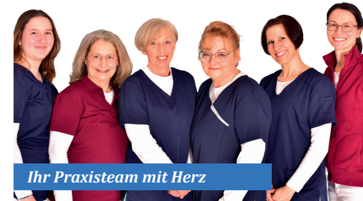
Ihr Praxisteam mit Herz