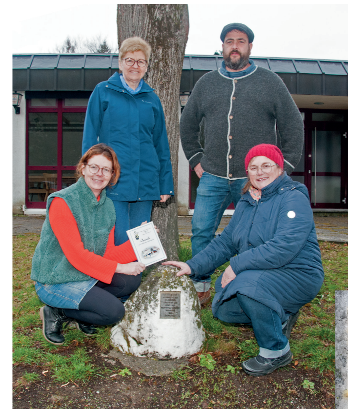
Vor der Mößmann-Halle pflanzte der Obst- und Gartenbauverein anlässlich deren Fertigstellung eine Linde, die inzwischen zu einem riesigen Baum geworden ist.

2021 hätte der Verein ja sein 125-jähriges Jubiläum feiern können, aber da kam die Coronazeit dazwischen und der Verein konnte es dann im Mai 2022 nachholen.