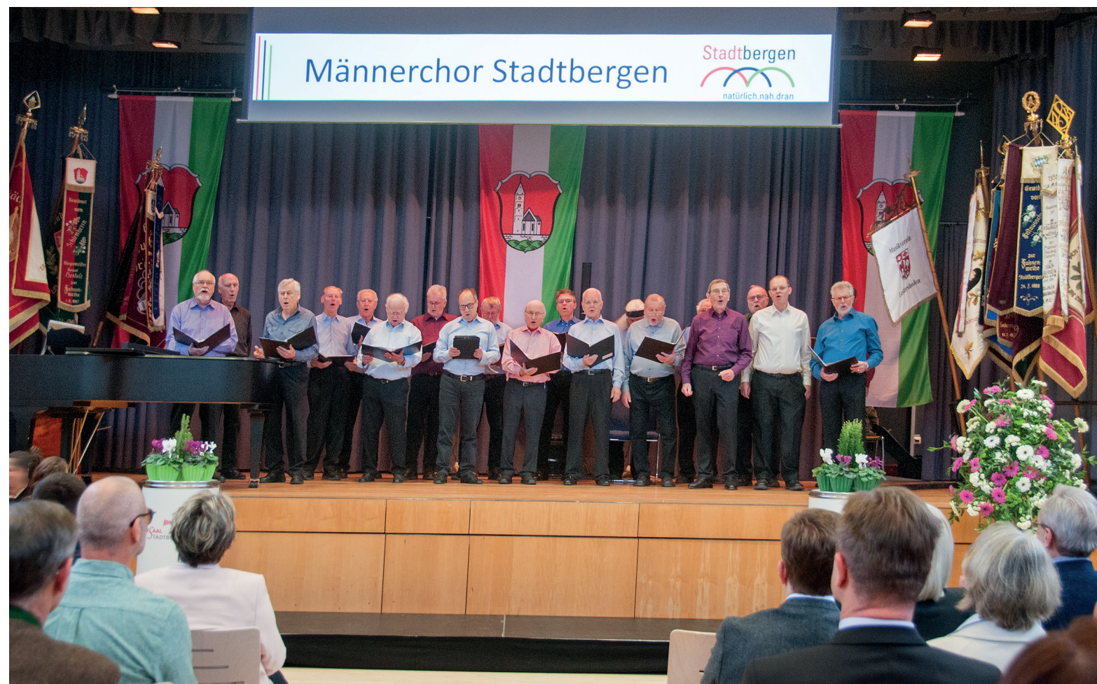
Einen musikalischen Auftakt lieferte der Männerchor Stadtbergen

„Prost Neujahr!“ – Mit der Einladung zu Speis, Trank und Gesprächen in Saal und Foyer schloss Erster Bürgermeister Paulus Metz den offiziellen Teil.