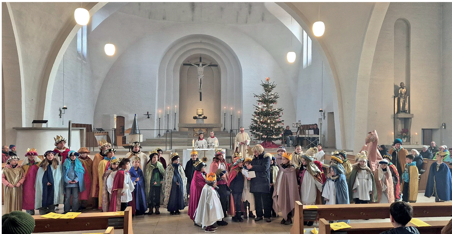
Sternsinger in St. Nikolaus und Maria Hilf, Stadtbergen

In Leitershofen waren am 1. und am 2. Januar 2026 insgesamt 42 Sternsingerinnen und Sternsinger mit Ihren Begleiterinnen und Begleitern unterwegs und sammelten im Ortsgebiet den Betrag von über 7.800 €. In einem feierlichen Gottesdienst am Dreikönigstag wurden die jungen Königinnen und Könige von Pater Jose Antony und Diakon Gerhard Zwiefler empfangen.