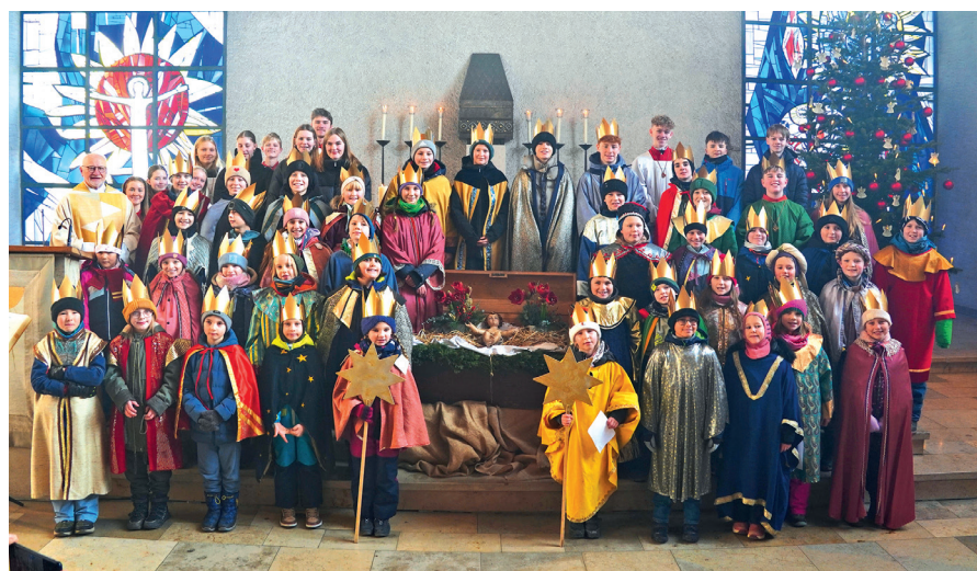
Sternsinger in St. Gabriel, Deuringen