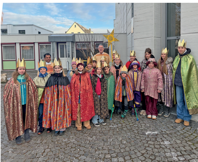
Sternsinger in St. Oswald, Leitershofen