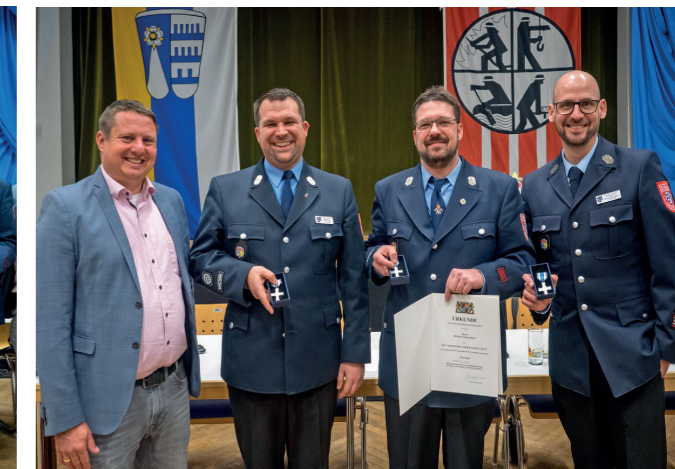
Bei der Ehrung für 25 Jahre aktiven Dienstes