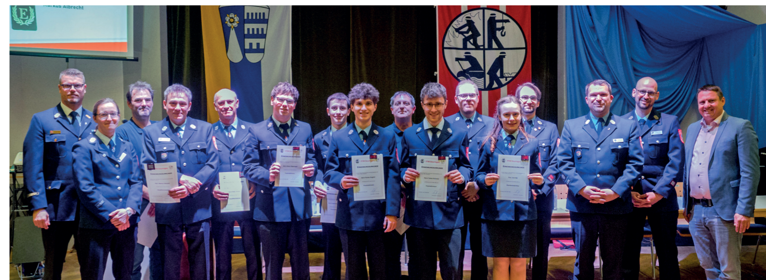
Gruppenfoto zur Erinnerung an die an diesem Tag ausgesprochenen Beförderungen