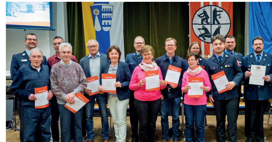
Ehrung langjähriger Mitglieder