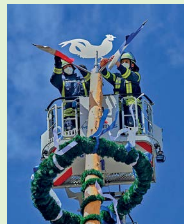
Vom Korb einer Drehleiter aus wurden der Wetterhahn und die Fahnen an der Spitze befestigt.