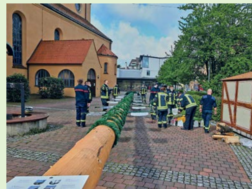
Diesmal ohne Zuschauer wurde der Baum am Kirchplatz vor der Herz-Jesu-Kirche aufgestellt.