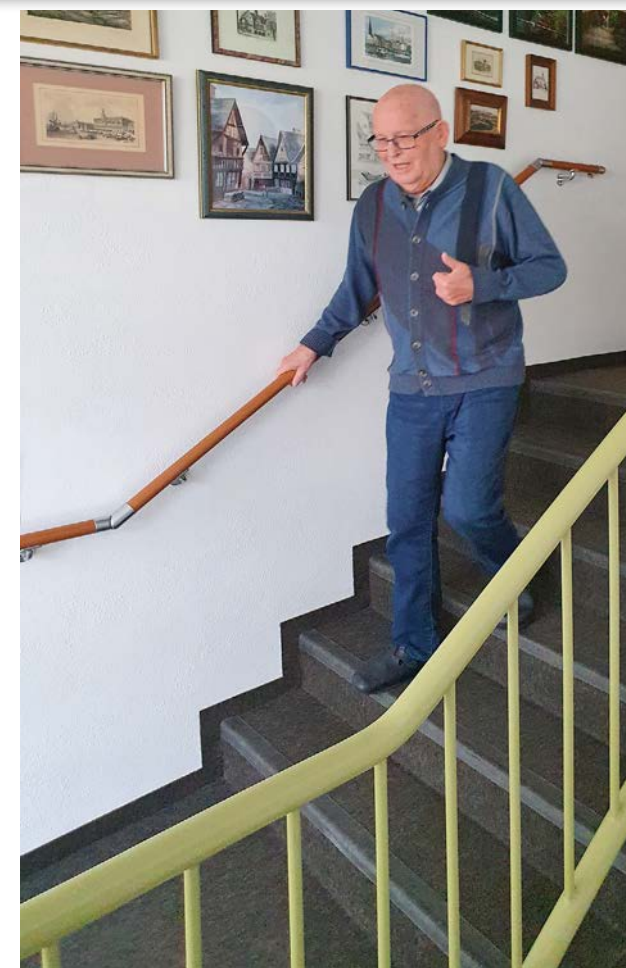
Die Treppe sicher und ohne fremde Hilfe bewältigen zu können, bedeutet für Herrn K. ein deutliches Mehr an Lebensqualität

Wenige Tage später war die Beratung der Fachfirma mit einer großen Auswahl an Handläufen vor Ort und ein normgerechter Handlauf gewählt, auch optisch passend zur vorhandenen Gestaltung der Treppenanlage. Trotz Corona erfolgte wenige Tage später schon die Montage im Treppenhaus und nun kann Herr K. selbständig und ohne fremde Hilfe die Treppen bis ins 2. Obergeschoss begehen. Er gibt nun gerne diese Erfahrungen weiter, wissen doch viele Menschen nicht, dass bei einer Pflegestufe oder Behinderung, egal ob als Mieter oder Miteigentümer, diese so-