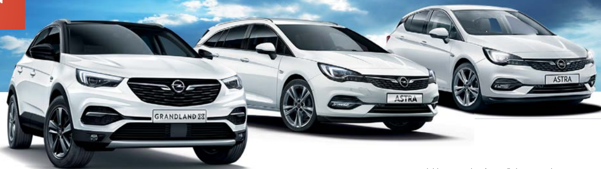
Beispielabb. mit mögl. aufpreispflichtiger Sonderausstattung

BIG DEAL ++ PLUS ++ 6 Jahre Garantie 1) 3 Inspektionen 2) + MATERIAL INKLUSIVE GESCHENKT!