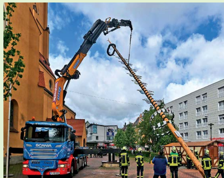
Am Haken eines Kranes schwebte der Baum in seine Halterung.