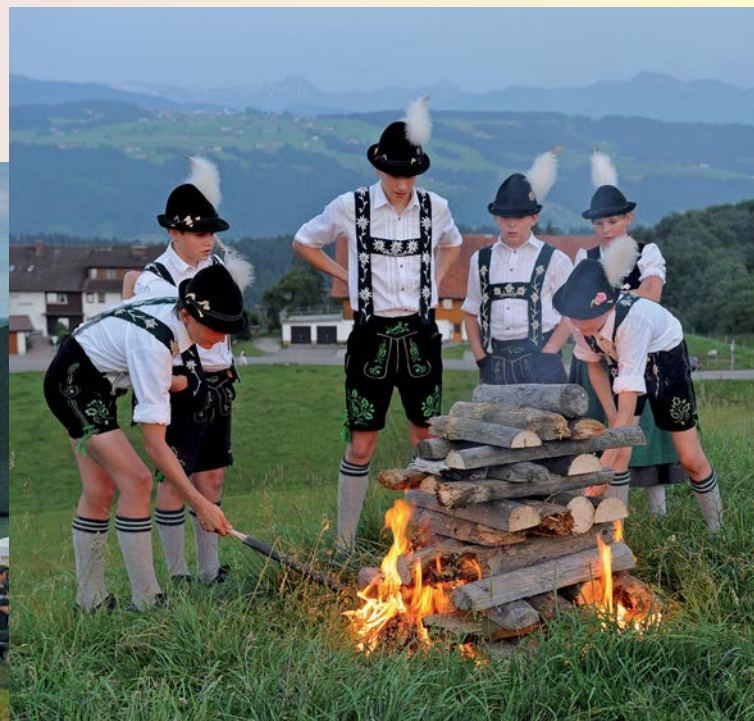
Bild oben: Brauchtumpflege im Allgäu: Beim Anzünden des Holzstoßes