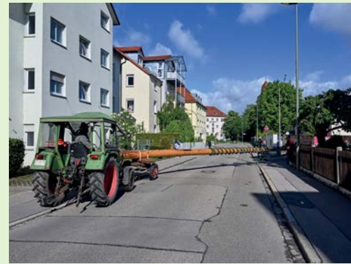
Millimeterarbeit bei der Ausfahrt aus dem Hof der Feuerwehr