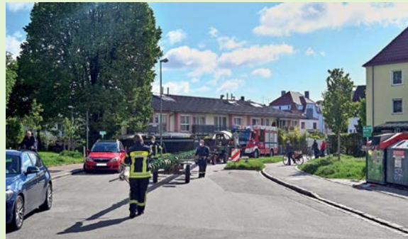
Mit dem 25 Meter langen Baum ging es mit der Spitze vorneweg durch Pferseer Nebenstraßen.