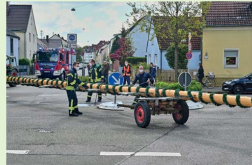
Rangierarbeiten an der Kreuzung Brunnenbachstraße