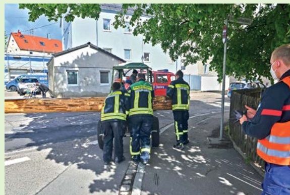
Mit Muskelkraft musste der Baum vorsichtig rangiert werden.