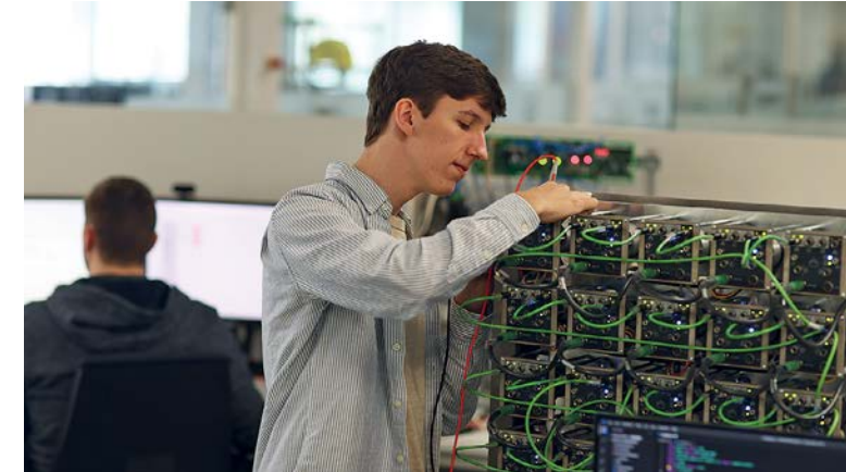
Ein Systemelektroniker beim Testen von Baugruppen in der Entwicklungsabteilung von Erhardt+Leimer

24 junge Mitarbeiter haben kürzlich ihre Ausbildung bei der Erhardt+Leimer Gruppe erfolgreich abgeschlossen, darunter sieben Systemelektroniker, vier Feinwerkmechaniker und drei Industriekaufleute. Alle jungen Facharbeiter wurden von der Firma übernommen und sind nun in den